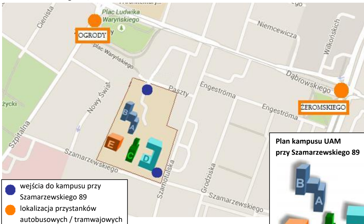
Plan kampusu UAM przy Szamarzewskiego 89