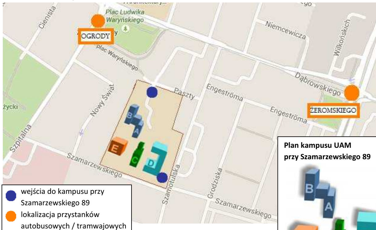
Plan kampusu UAM przy Szamarzewskiego 89